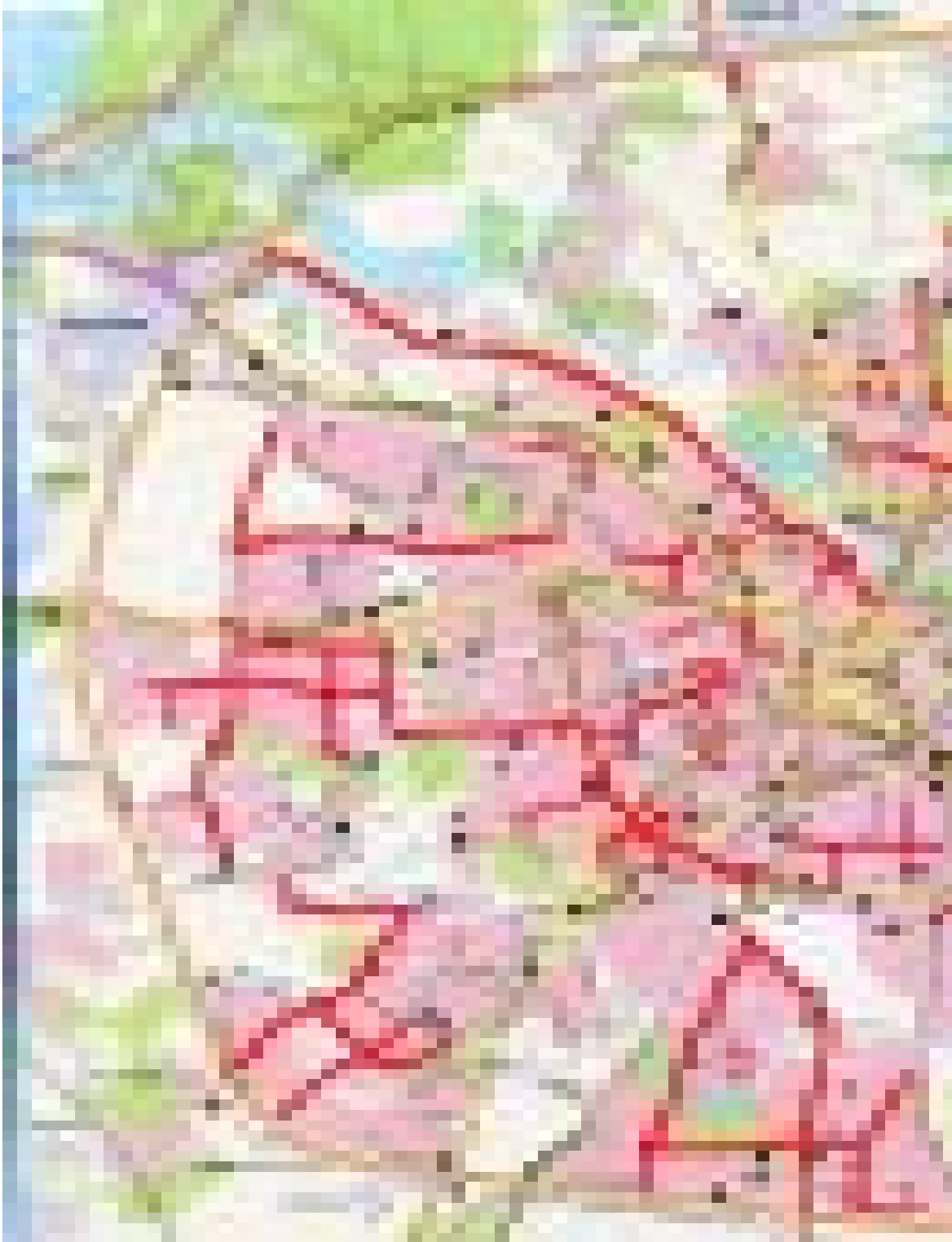
Малюнак 1. Сетка вуліц Мінска, назвы якіх звязаныя з Вялікай Айчыннай вайной (вылучаныя чырвоным).