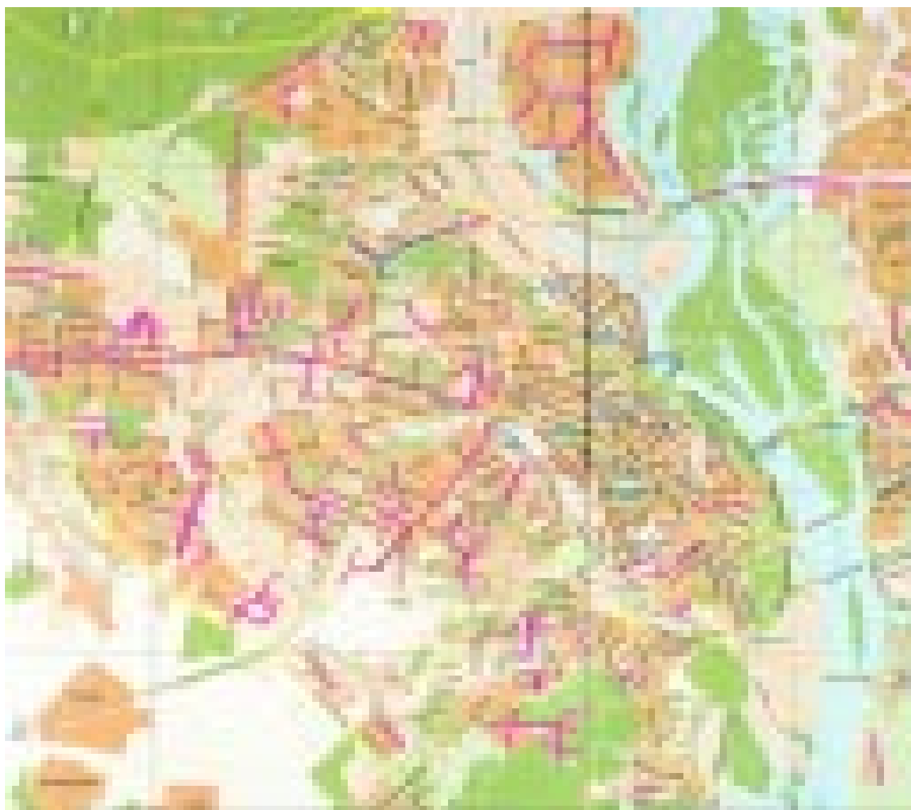
Малюнак 4. Вуліцы Кіева, назвы якіх звязаныя з Другой сусветнай вайной, у 2008 г. (вылучаныя чырвоным).