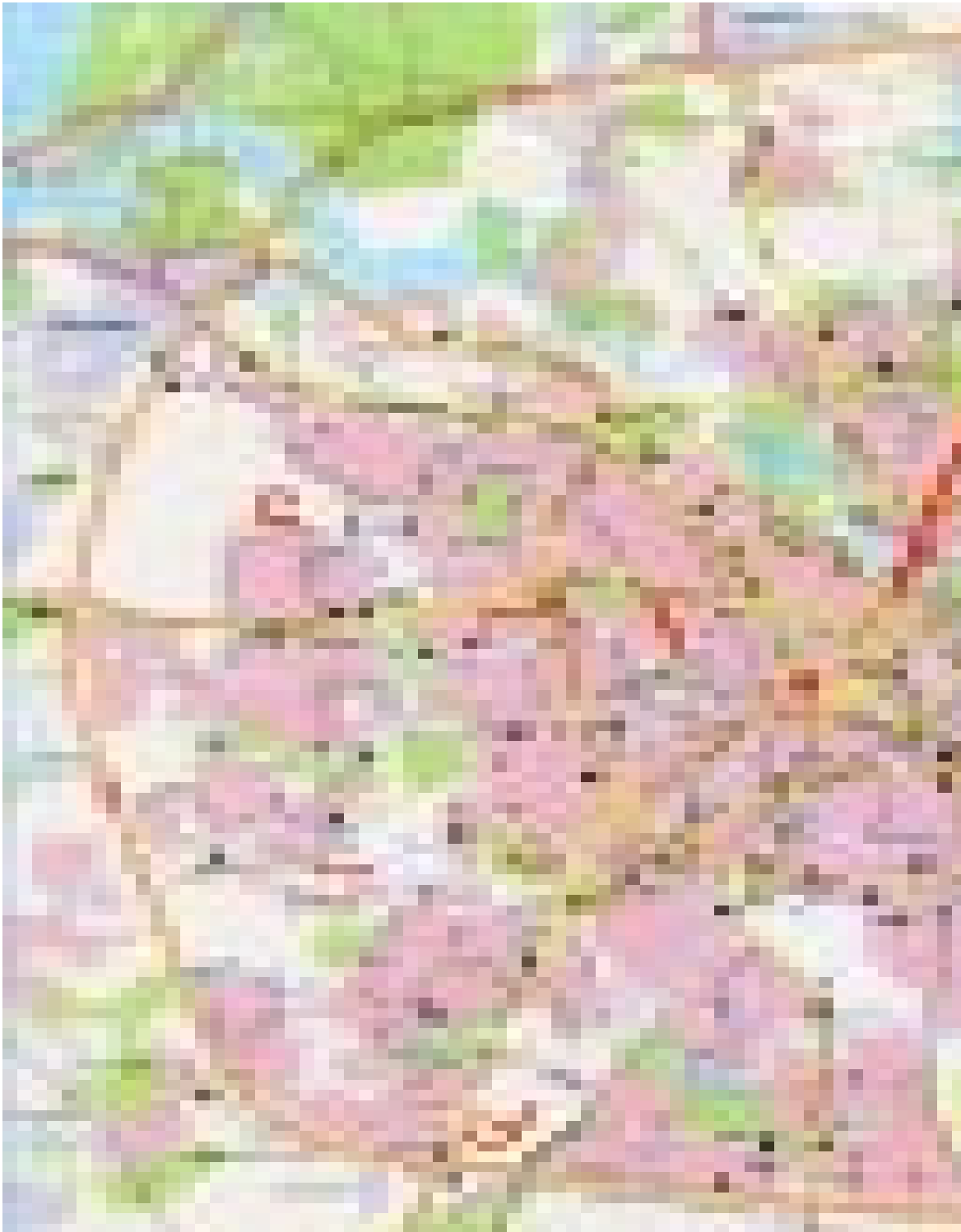
Малюнак 2. Сетка вуліц Мінска, назвы якіх звязаныя з беларускай гісторыяй і культурай дасавецкага перыяду (вылучаныя чырвоным).