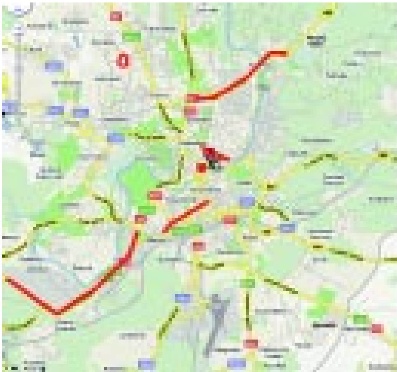
Малюнак 5. Вуліцы Вільні, назвы якіх нагадвалі пра Вялікую Айчынную вайну, у 1969–1989 гг. (вылучаныя чырвоным).